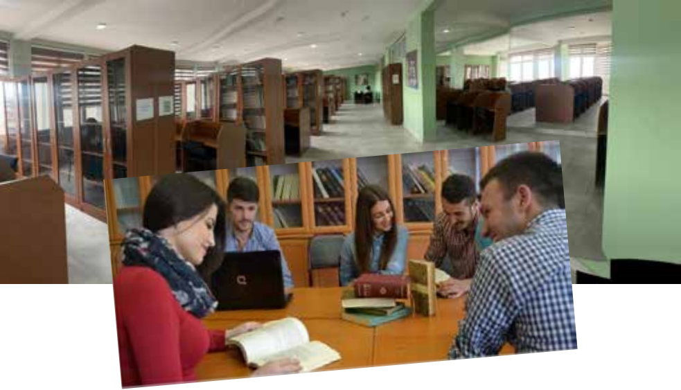
Njëra nga sallat e leximit në bibliotekë

UKZ është i përkushtuar për ndjekjen e dijes, por edhe mban përgjegjësi për ofrimin e një baze shkencore për vetë-reflektim në shoqëri, duke kontribuar në masë të madhe në drejtim të zhvillimit të saj pozitiv, duke ofruar literaturë në bibliotekën e Universitetit si për stafin akademik po ashtu edhe për studentët.