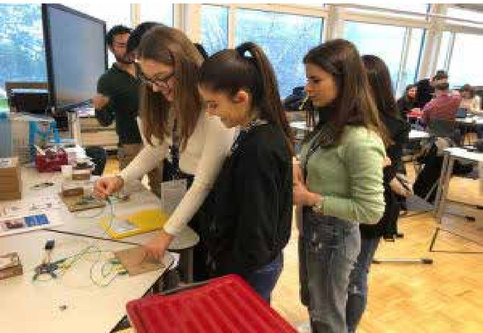
Studentët e UKZ-së dhe ZUG gjatë aktiviteteve të përbashkëta në Zvicër