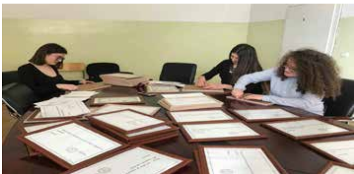
Studentët duke vendosur thëniet e tyre personale apo të zgjedhura nga autorë të ndryshëm

Studentët e Universitetit “Kadri Zeka” në Gjilan, realizojnë aktivitetet për nder të festave të marsit.