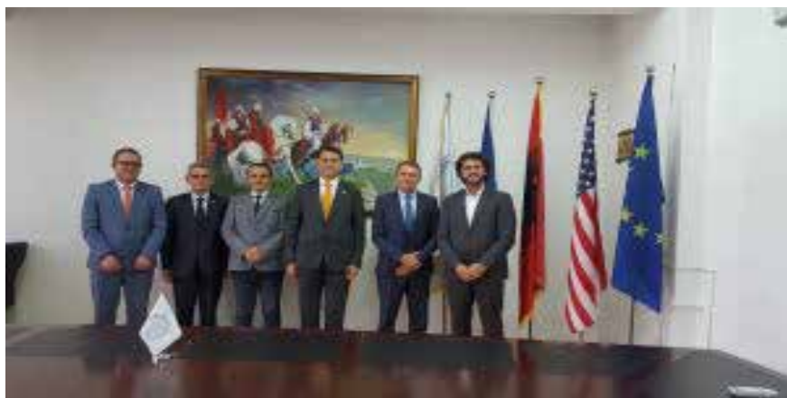
Rektori Bajram Kosumi është zgjedhur kryetar i Konferencës së Rektorëve të Kosovës

Kjo trupë ndihmon, po ashtu, edhe në harmonizimin i IAL dhe MASHT në planifikimin për numrin e regjistrimeve të reja të studentëve, orientimin e bursave studimore për studentët dhe aspektet tjera organizative të përgjegjësive të përbashkëta.