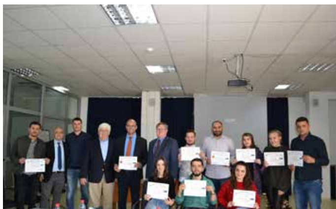
Foto nga organizimi i marrjes së certifikatave