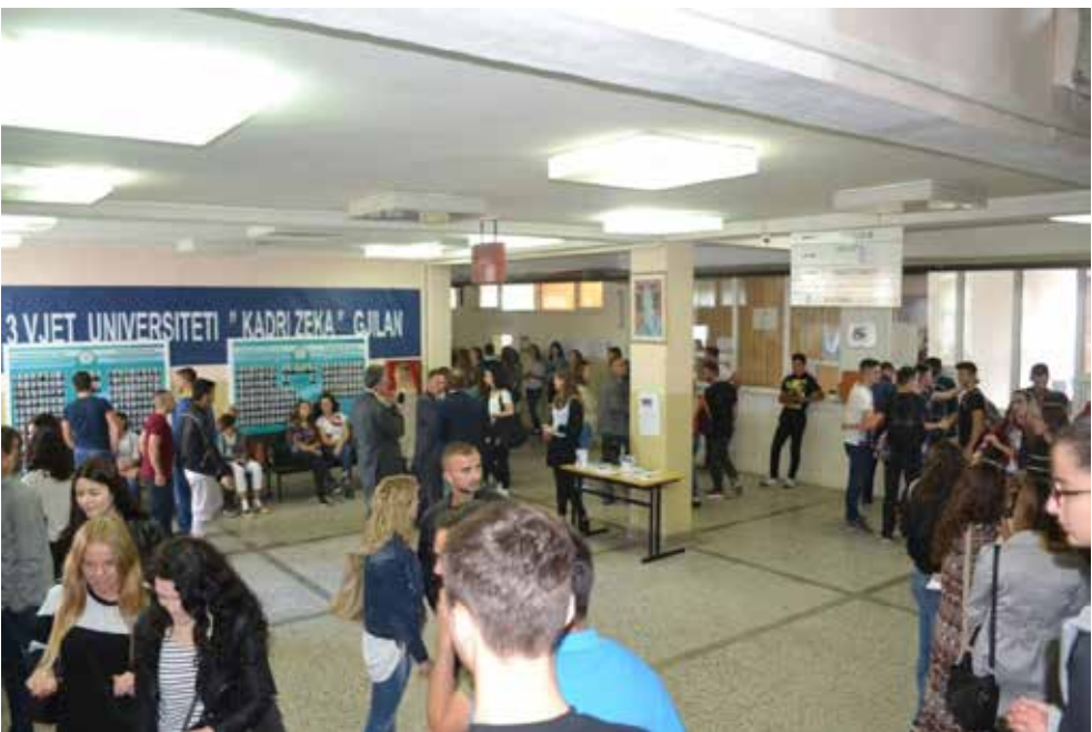
Pamje nga ambientet e Universitetit