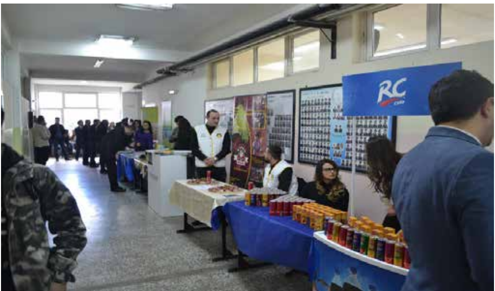
Organizimi i panairit të bizneseve nga UKZ