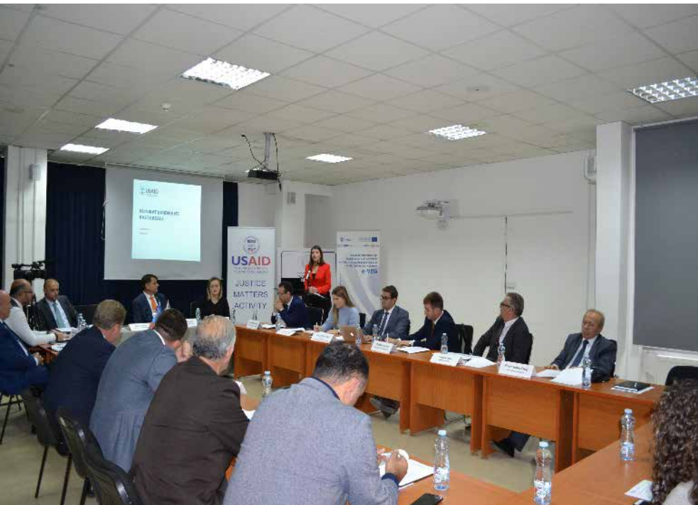
Gjatë organizimit të Klinikës Juridike me raste reale

Universiteti “Kadri Zeka” në Gjilan, përkatësisht Fakulteti Juridik, me mbështetjen e Aktivitetit të USAID-it “Drejtësia Vlen” dhe në bashkëpunim me Odën e Avokatëve të Kosovës, ka krijuar “Klinikat juridike me raste reale”.