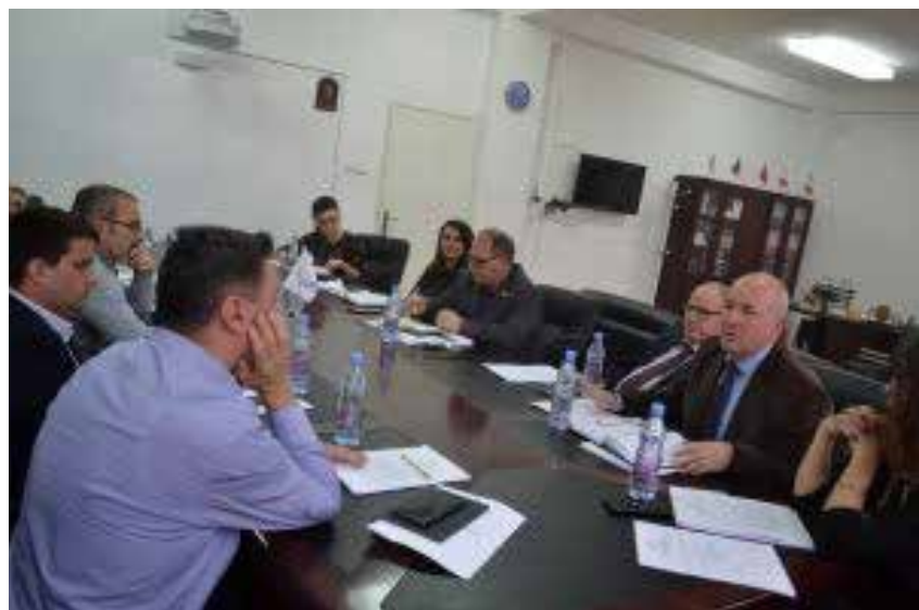
Gjatë takimeve për koordinim të punëve për cilësi me stafin akademik