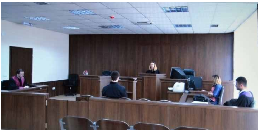
Një nga seancat simulative te studentëve të UKZ-së