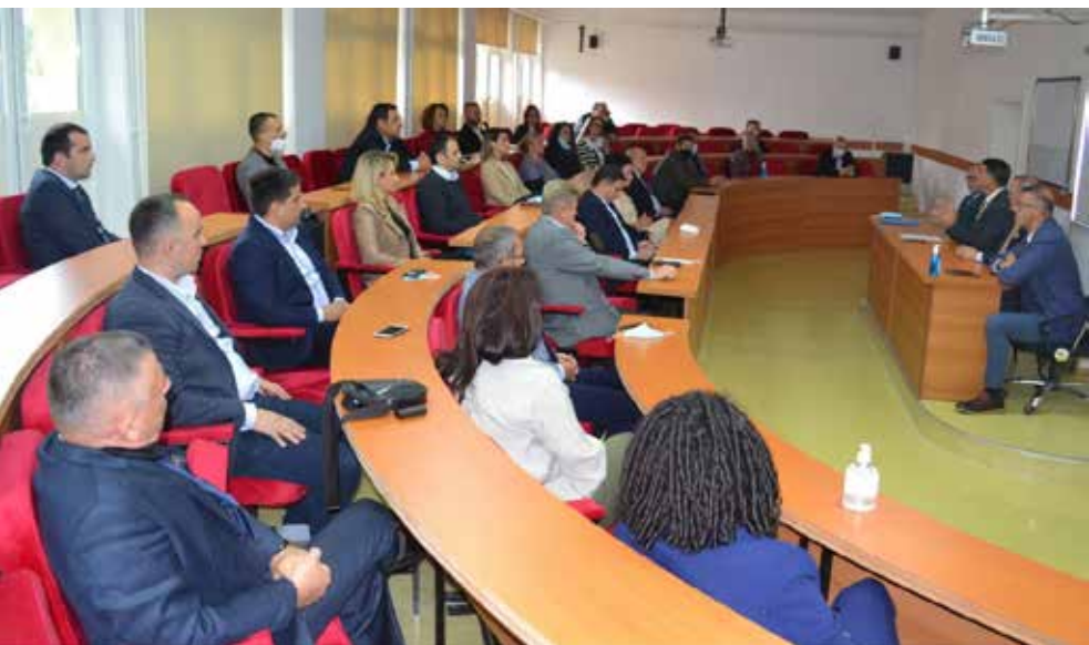
Amfiteatri B 01, i rinovuar

Më mungesë të kampusit të ri, UKZ ka rinovuar pjesë të ndryshme të kampusit aktual, duke e përshtatur me nevojat e studentëve, si janë për shembull, amfiteatrot dhe biblioteka.