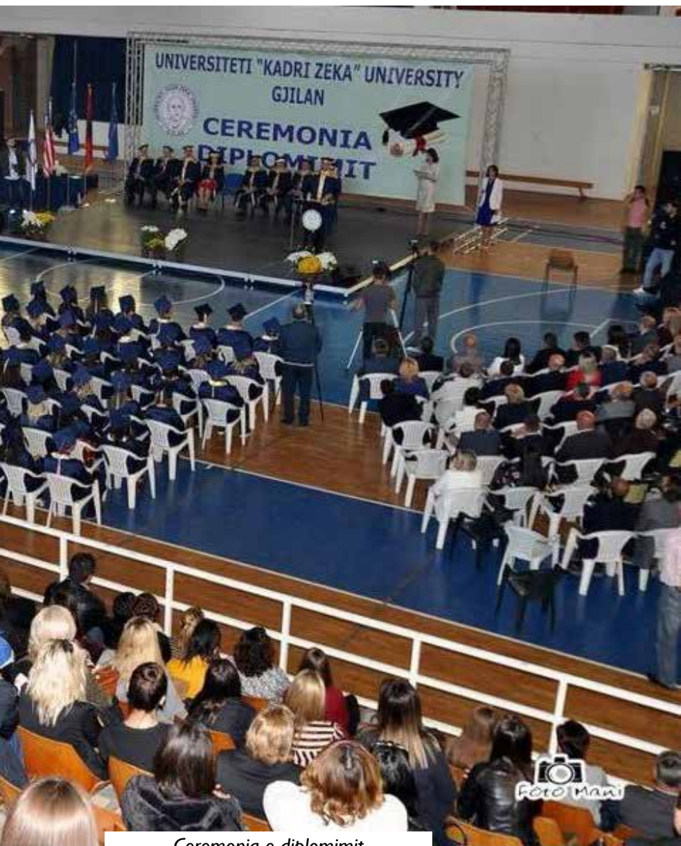
Ceremonia e diplomimit