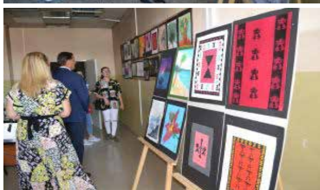
Disa nga ekspozitat e organizuara në UKZ