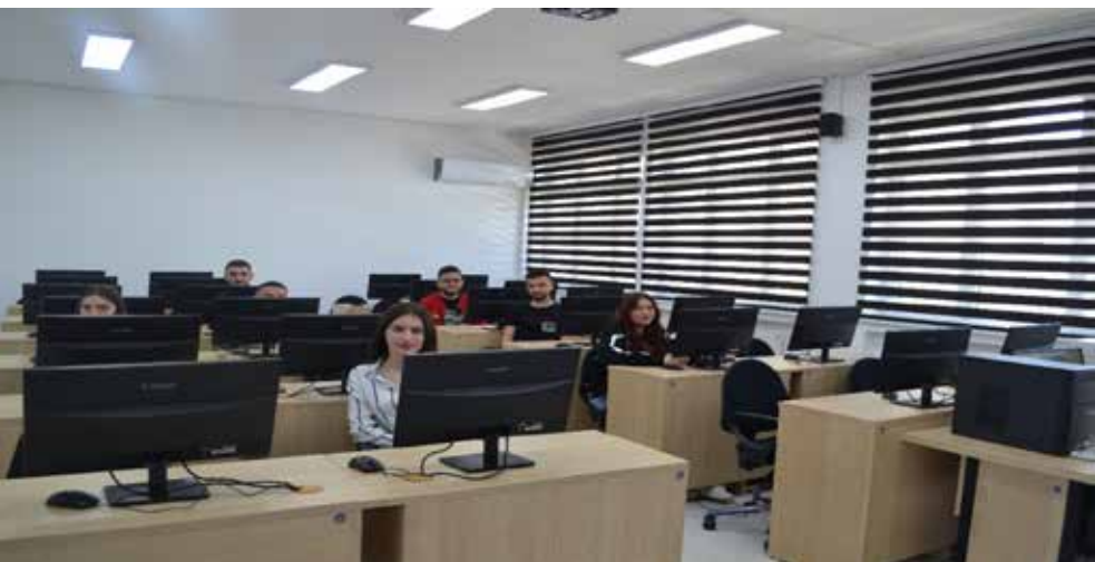
Laboratori I- Shkenca Kompjuterike