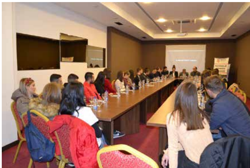
Gjatë organizimit të kampanjës kundër kopjimit