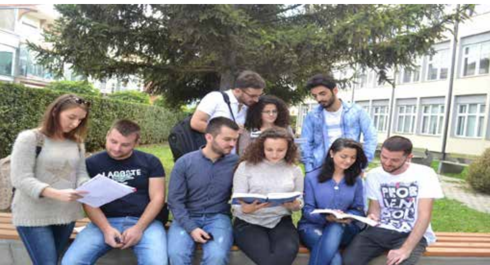
Studentët duke bashkëpunuar