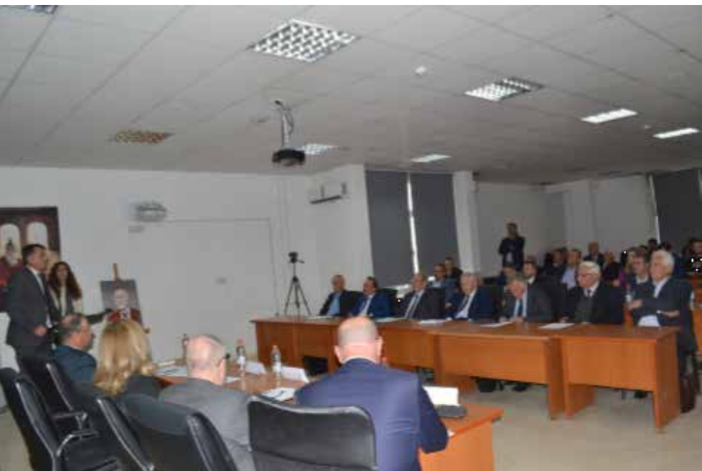
Konferenca Shkencore për Arbëreshët, shtator 2022