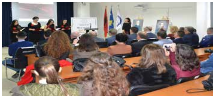
Recital i studentëve të UKZ-së për festat e nëntorit