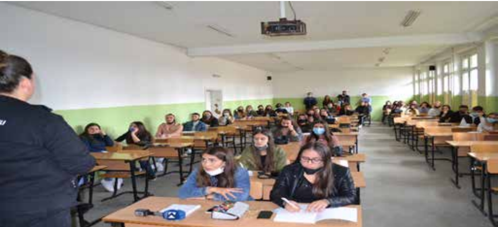
Studentët ushtrojnë maturantët

Studentët e Universitetit “Kadri Zeka” në Gjilan, realizojnë aktivitetet për nder të festave të marsit.