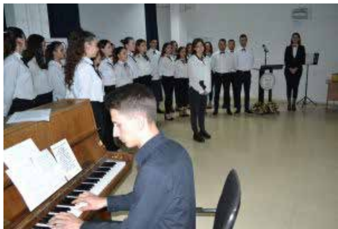
Kori i UKZ-së