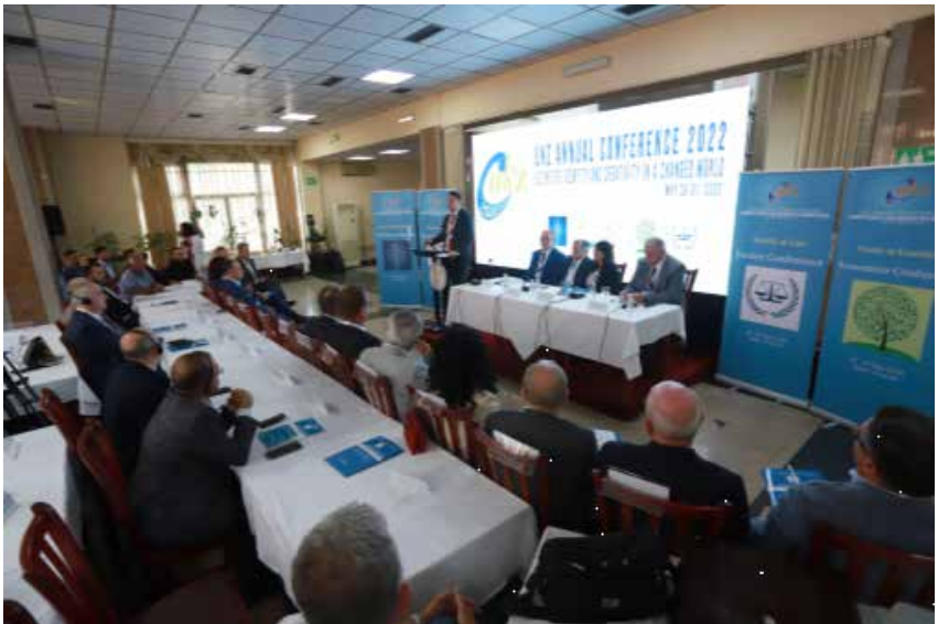
Konferenca Shkencore Ndërkombëtare “Identiteti shkencor dhe kreativiteti në një botë të ndryshuar” maj 2022

Po ashtu jepet Çmimi i Konferencës Vjetore të UKZ-së “Marin Barleti” i cili i dedikohet arritjeve akademike në arsimin e lartë, kontributeve thelbësore kërkimore, çështjeve të reja, ideve, bashkëpunimit dhe perspektivave ndërkombëtare.