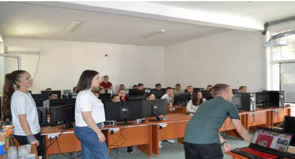
Laboratori II-Aktivitet i Klubit të IT-së

Association of Technology, Management, and Applied Engineering (ATMAE)”, një agjenci homologe e AKA-së ne SHBA, e cila mbulon me akreditim gjithë Shtetet e Bashkuara të Amerikës në fushën e teknologjisë, menaxhmentit dhe inxhinierisë aplikative.