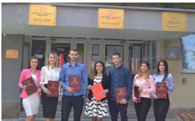
Studentët pas mbrojtjes së temës së diplomës

Të dhënat tabelare tregojnë se Arsimi Fillor dhe Arsimi Parashkollor mbeten programe të kërkuara. Interesimi i studentëve në programet master, Mësimdhënie në Gjuhë e Letërsi Shqipe e në veçanti për programin Mësimdhënie dhe Kurrikula për Arsimin Fillor, është shumëfish më i lartë sesa kuotat e përcaktuara. Gjithashtu në programin Shkenca Kompjuterike numri i të interesuarve për të ndjekur studimet është në rritje e sipër.