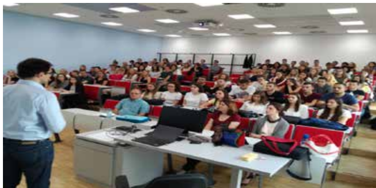
Gjatë vizitës së studentëve të UKZ-së në Graz

Rreth 15 studentë të Fakultetit të Shkencave Kompjuterike të UKZ-së, kanë marrë pjesë në punëtorinë për zhvillim të moduleve inovative, në kuadër të projektit REBUS, pjesë e të cilit është UKZ, e cila punëtori ka zgjatur 15 ditë dhe është mbajtur në Graz të Austrisë.