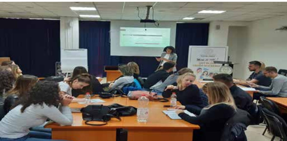
Studentët e ZUG-ut në UKZ gjatë një ligjëratae