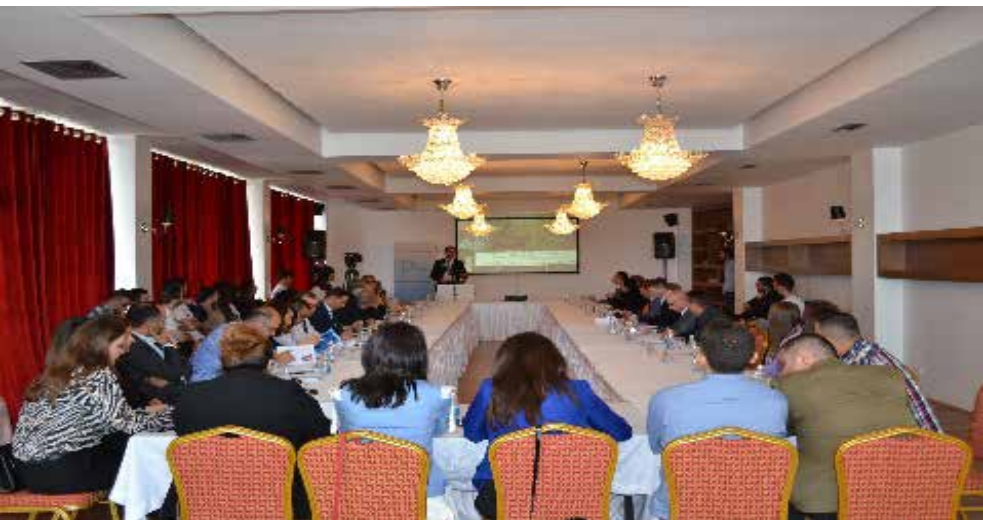
Gjatë konferencës DiGiDay 2019

Fakulteti i Shkencave Kompjuterike ka organizuar Konferencën DiGiDay 2019 , në bashkëpunim me Universitetin e Podgoricës, Universitetin e Korçës “Fan S.Noli”, Universitetin e Elbasanit “Aleksandër Xhuvani”, Universitetin e Shkupit “Nënë Tereza”, Universitetin e Vlorës “Ismail Qemajli” dhe Universitetin e Mitrovicës “Isa Boletini”.