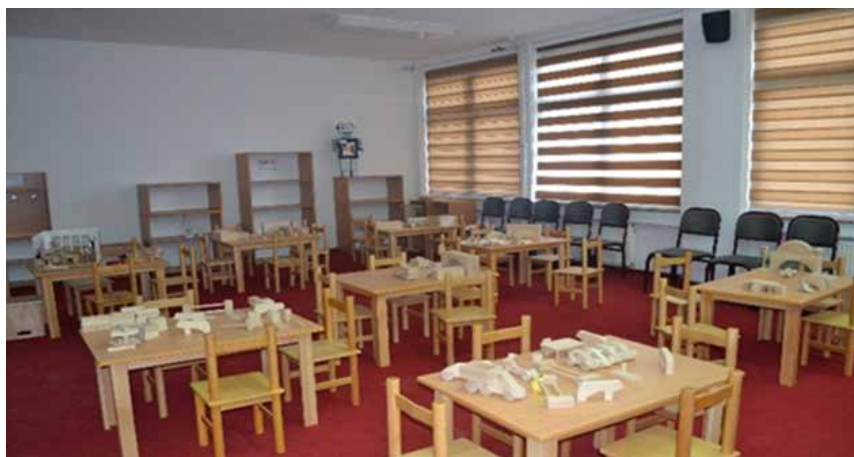
Sallë për aktivitete praktike për parashkollorët