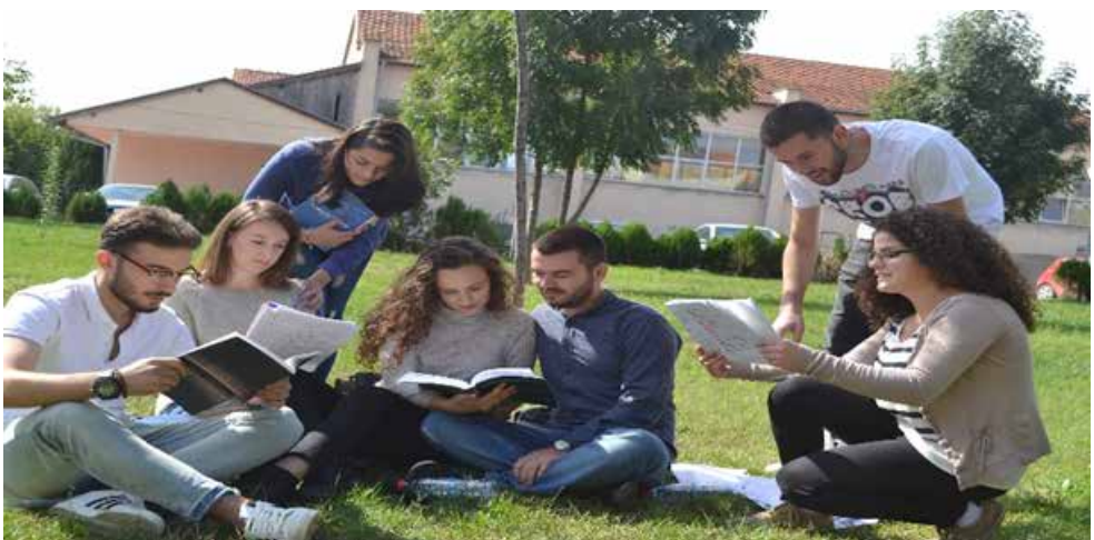
Ne mësojmë së bashku!