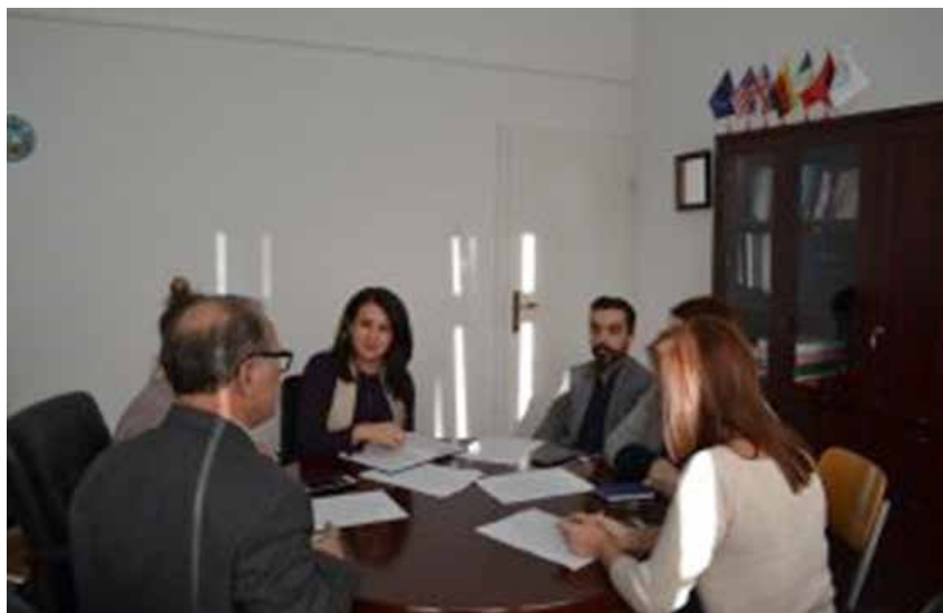
Gjatë takimeve për koordinim të punëve për cilësi me stafin administrativ