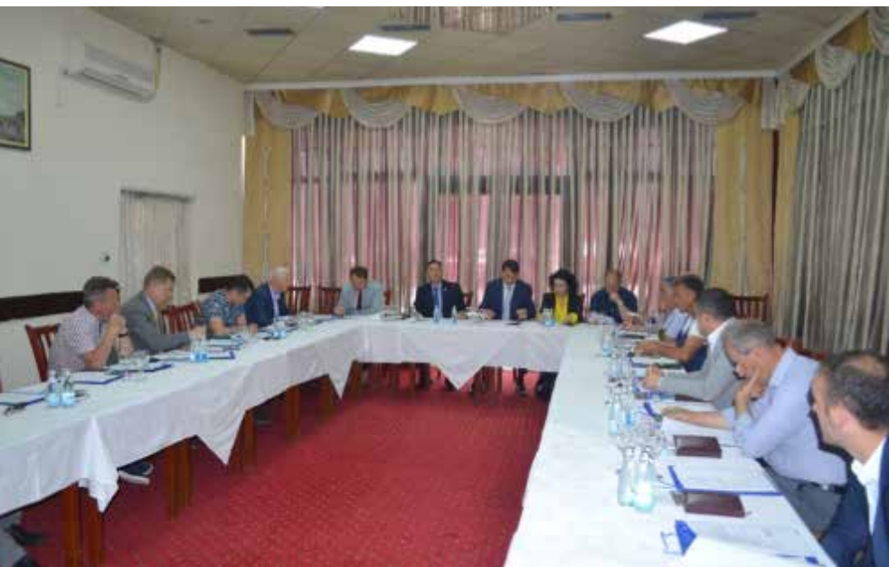
Nga takimi me BI

Universiteti Publik “Kadri Zeka” në Gjilan, në vitin 2018, në takim me përfaqësues të Institucioneve komunale, kompanive dhe bizneseve, që veprojnë në rajonin e Anamoravës ka themeluar Bordin Industrial të Universitetit.