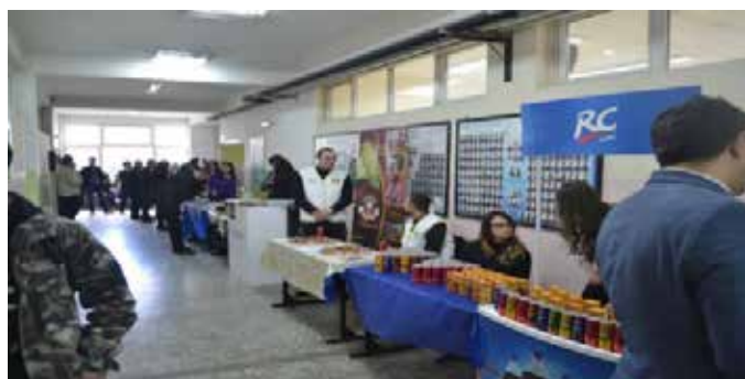
Gjatë panairit “Ndërtojmë partneritet”

Universiteti “Kadri Zeka” çdo vit merr pjesë në Panairë të Punës dhe Karrierës, duke prezantuar punën, aktivitetet dhe të arriturat e tij.