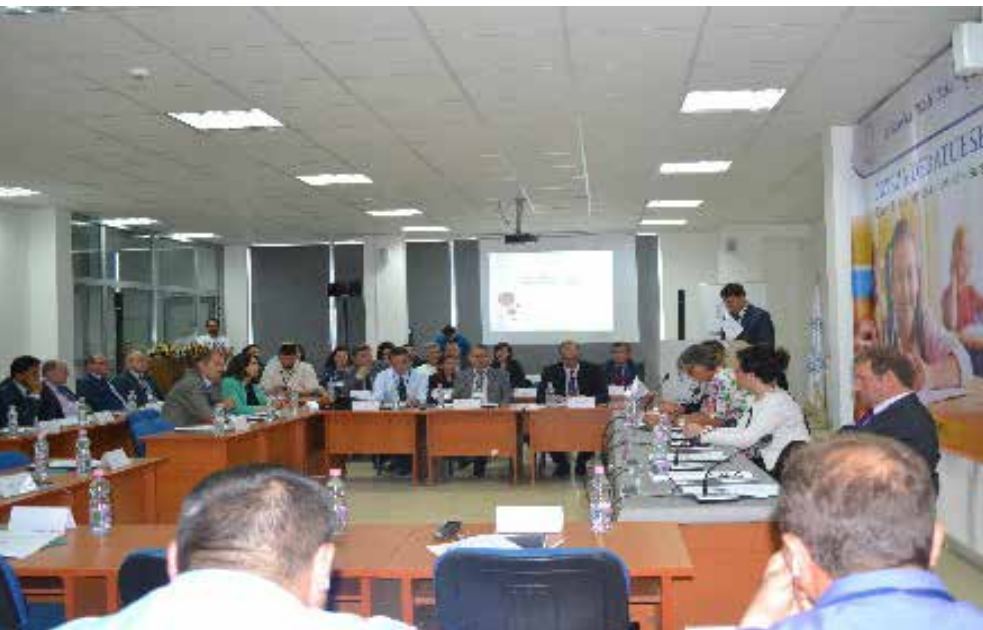
Konferenca për projektin “Shkollat fillore një apo më shumë mësues”

Projekti i UKZ-së i krijuar në bashkëpunim me GIZ dhe MASHT, “Shkollat fillore një apo më shumë mësues”, është zgjeruar implementimi i këtij projekti edhe në shkollat tjera në komunën e Gjilanit dhe më gjerë. Ky projekt ka filluar që nga viti 2014, i cili është aktual edhe sot.