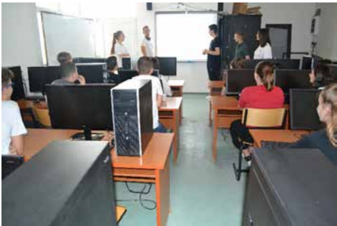
Aktivitet i Klubit të IT-së