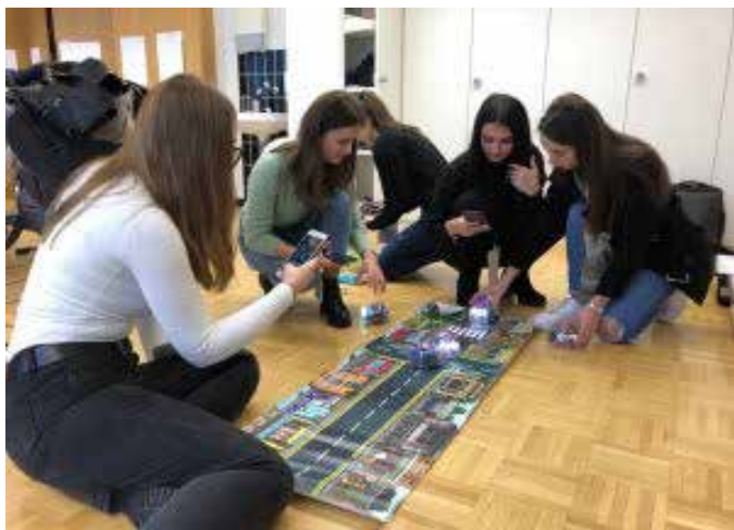
Studentët e UKZ-së dhe ZUG gjatë aktiviteteve të përbashkëta në Zvicër

Në këto vizita rreth 20 studentë nga UKZ dhe PH Zug kanë mundësi të shkëmbejnë përvojat dhe praktikat e tyre studimore nëpër universitetit përkatëse. Gjatë vizitave të ndërsjella, studentët qëndrojnë nëpër familjet shqiptare respektivisht zvicerane, për të mësuar më shumë për sistemin arsimor, për kulturën, për traditat dhe në përgjithësi për jetën që zhvillohet në të dy shtetet.